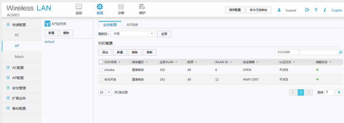
图 3. WEB网管配置界面

以AP组为中心，常用参数默认选中，无需预先配置，简化配置步骤；针对业务差异小的配置，支持参数复制功能，仅需修改差异配置，提高配置效率。